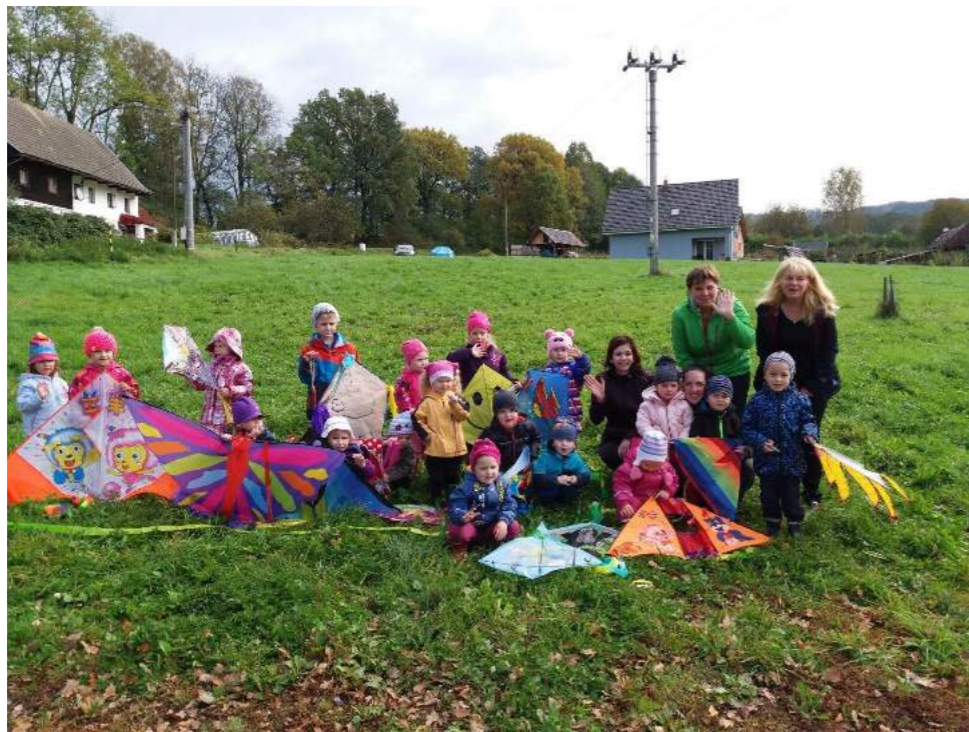
kollektiv MŠ Kytíčka

Od prvních dní školního roku se děti v naší mateřské škole nenudí. Na začátku září jsme s rodiči a dětmi vyjeli do Starých Splavů na víkendový adaptační pobyt. Počasí nám přálo, program byl bohatý. Všichni jsme si užili cestu k Máchovu jezeru plnou úkolů, stezku odvahy a opékání buřtů. Během měsíce září si každé dítě do školky přineslo své nejhezčí jablíčko. Každé jablíčko bylo něčím zajímavé a tak si diplom zasloužili všichni. Po vyhodnocení soutěže jsme plody nakrájeli a usušili z nich křížaly. V polovině měsíce října jsme uspořádali Drakiádu. Barevní draci létali pod modrou oblohou a děti radostí jen zářily. Na podzim, kdy je příroda plná barev pracují děti s nejrůznějšími přírodninami, které použily i při vytváření vily Podzimničky.