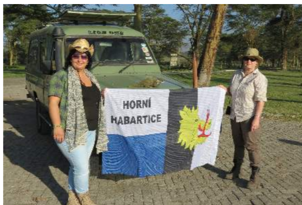
... tak už máme i foto z Keni - listopad 2017