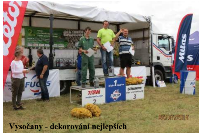
Vysočany - dekorování nejlepších

V dalším pokračování o našich traktorech se podíváme do Vysočan u Chomutova a do Troskovic - Semína. V obou případech jsme se vydali na krajské kolo mistrovství v orbě a pokaždé to stálo za to.